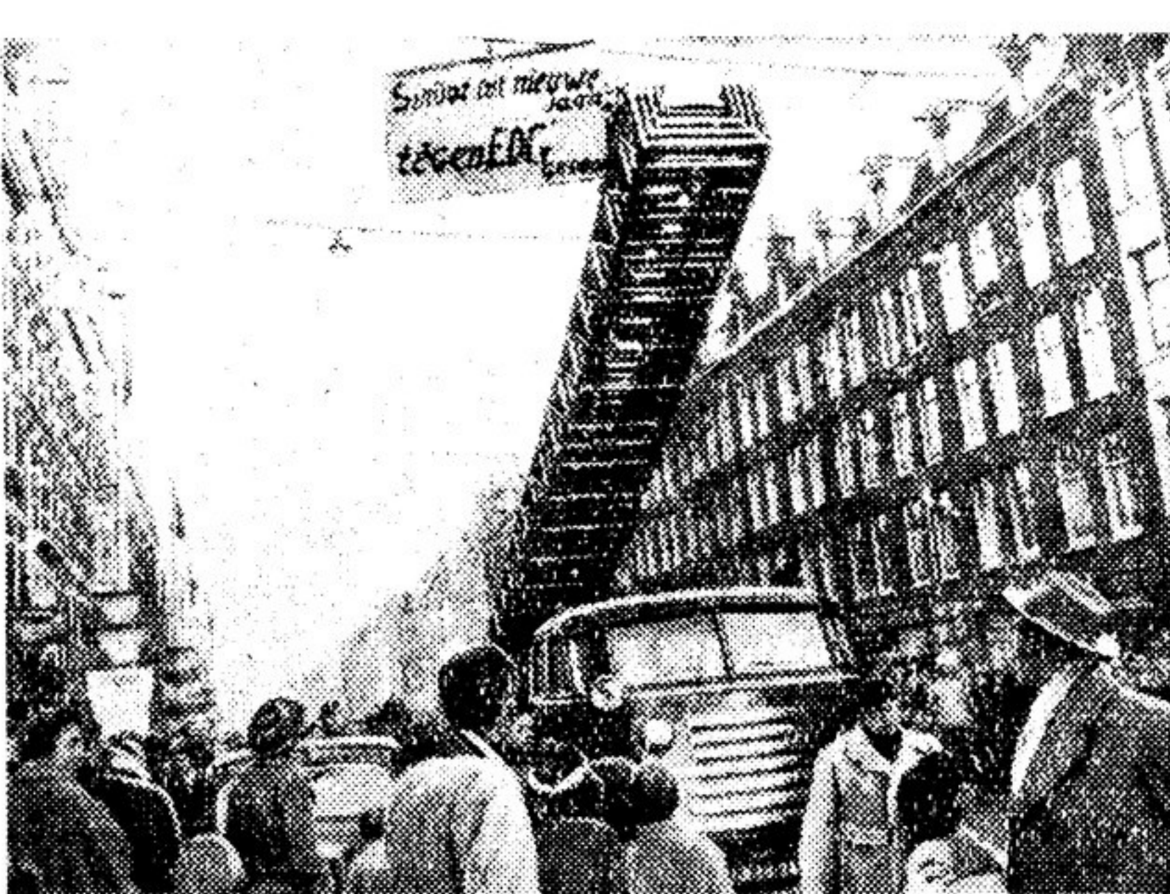
Пропаганда, которая невозможна при существовании «Европейского оборонительного сообщества».

Не только Совет мира борется против ревизионизации Германии. Антифашистская организация бывших участников движения Сопротивления, в которой состоят люди различных политических убеждений, объявила себя решительным противником «Европейского оборонительного сообщества». Ее примеру последовали многие общественные организации, комитеты, союзы. Все они отражают чаяния многих голландских патриотов, их стремление к созданию подлинной безопасности в Ев-